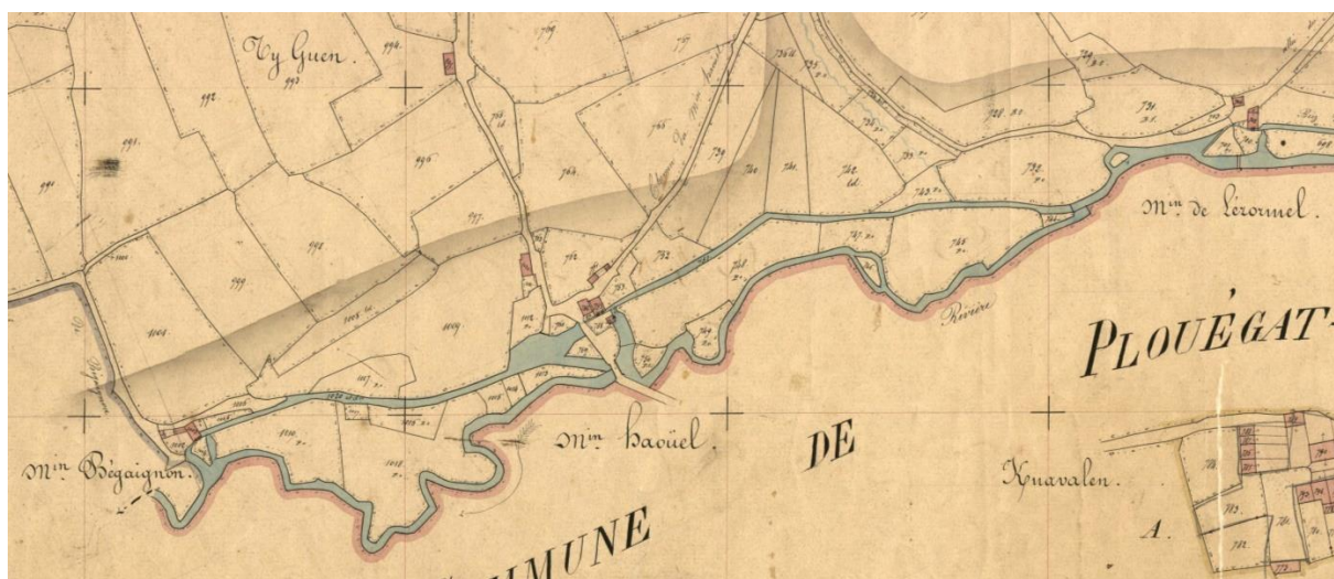
Emplacement des moulins situés sur Le Douron sur le cadastre de 1848

Sur les plans cadastraux napoléoniens de 1813-1814, on peut relever précisément l'emplacement des moulins situés sur le Douron : le moulin de Trébiand, le moulin de Limgang, le moulin de Kévelégand, le moulin de Perceval, le moulin de Lézormel, le moulin de Haouël, le moulin de Bégaignon, le moulin du Porjou, le moulin de la Vicométe, le moulin de Lesmaez, le moulin de Rochelan, le Moulin Neuf et le Vieux Moulin à vent. Sur le cadastre de 1848, n'apparaissent plus que le moulin de Lézormel, le moulin de Lesmaës, le moulin de la Vicométe, le moulin de Rochelan et le nouveau moulin Julien. Ces nombreux cours d'eau alimentaient plusieurs minoteries. Au milieu du XX e siècle, le moulin de Rochelan alimentait une petite usine hydro-électrique à partir des moulins du château de Lesmaës. On remarque aussi l'existence d'une briqueterie au début du XX e siècle près du site du moulin. Les plus anciens moulins de la commune sont le moulin de Bégaignon (abandonné après des tentatives de restauration) et le moulin de la Vicométe en Traou Huellan (abandonné).