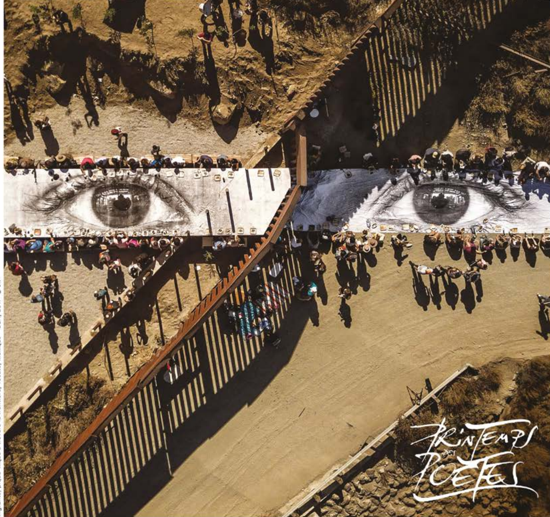
Migrants, pique-nique à travers la frontière, Tecate, Mexique - USA, 2017 © JR