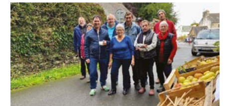
L'équipe du jardin des petites mains