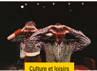
Culture et loisirs