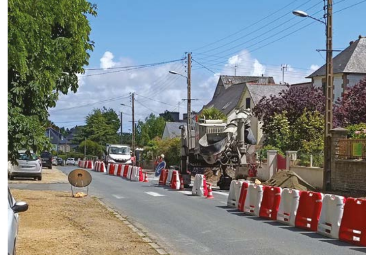
Travaux sur la RD 786