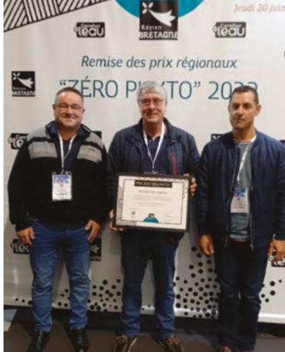
Remise des prix régionaux "Zéro Phyto" 2022