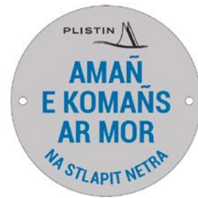
Opération "La mer commence ici" : installation de plaques sur le réseau d'eaux pluviales