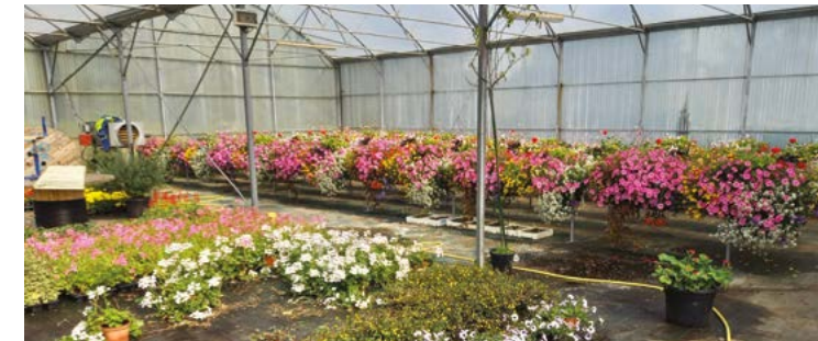
Les serres communales