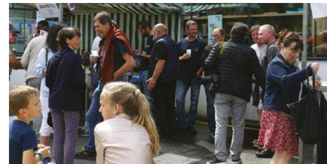
Bon'jour, le 22 juin 2022