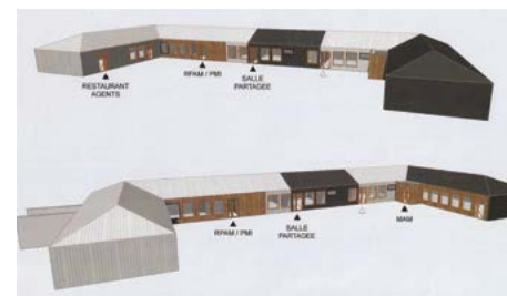
Projet LAAB Fauquert Architectes