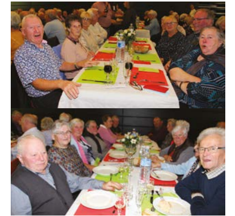
Le repas des aînés