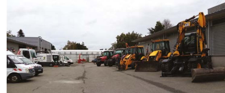
Portes-ouvertes aux services techniques