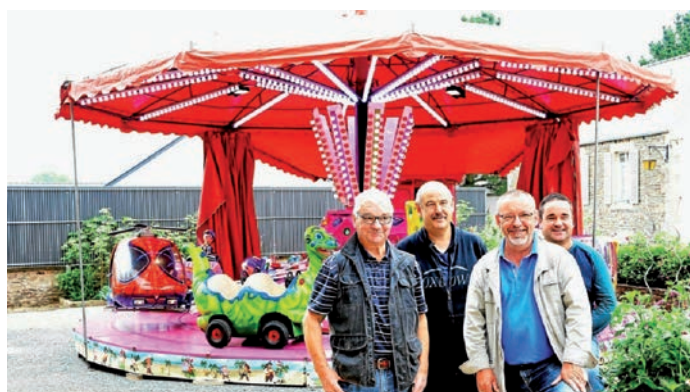
Le manège a pris place dans le square