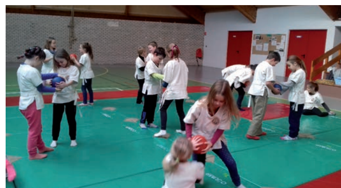
Atelier Gouren, école élémentaire du Penker