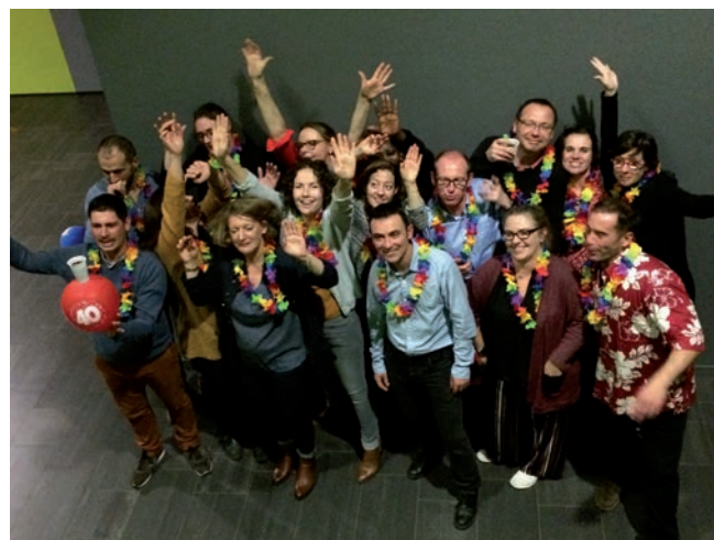
Repas des Quaranténaires