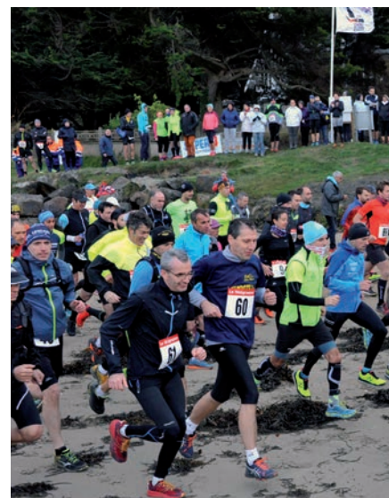
Trail des Chapelles