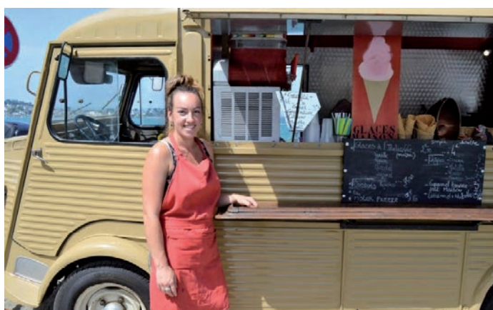
Food truck à la plage des Curés et à St Eflam