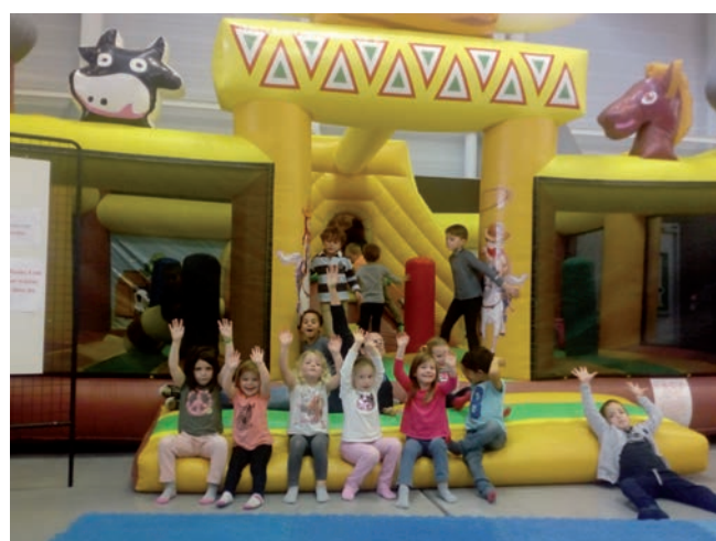
Sortie du Centre de Loisirs