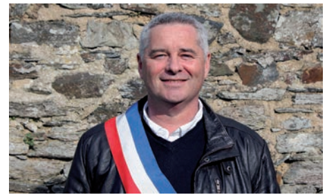
PERMANENCE du Maire. sur rendez-vous le samedi matin et le mercredi après-midi

Concernant l'avenir de notre cité, je tiens tout d'abord à remercier les nombreux plestinais qui ont participé aux différents temps de consultation publique organisés par notre bureau d'étude dans le cadre du projet de revitalisation du centre-ville. Cette phase « étude » se terminera en février et nous permettra de présenter des fiches actions pour la phase