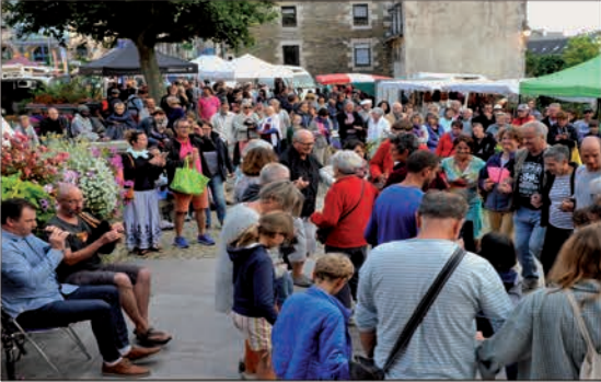
Bilan de la saison estivale