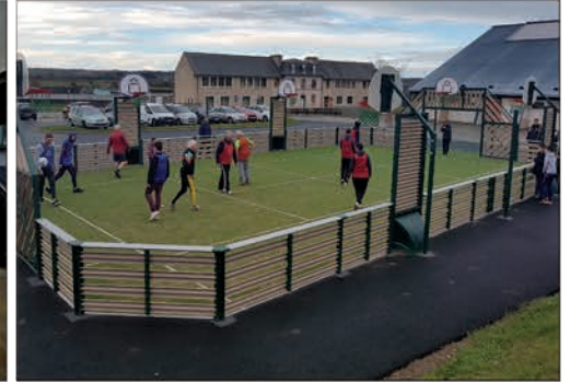
Un nouvel équipement pour les jeunes