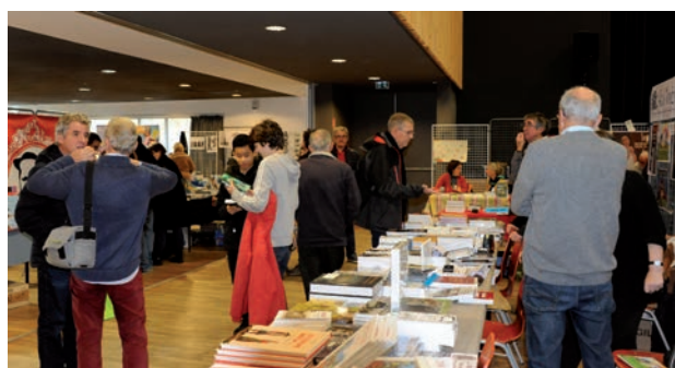
Salon du Livre