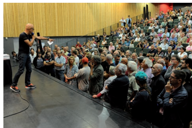
Jeu des 1000 euros