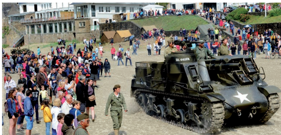
Author II : 75 ans du débarquement