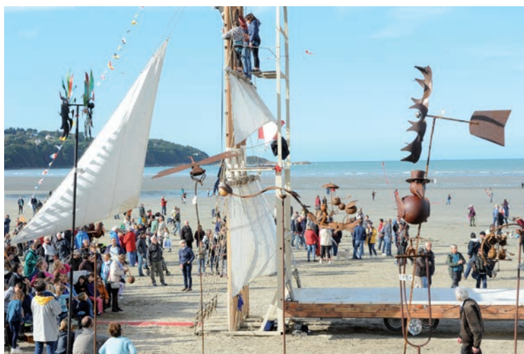
Festival Vent de grève