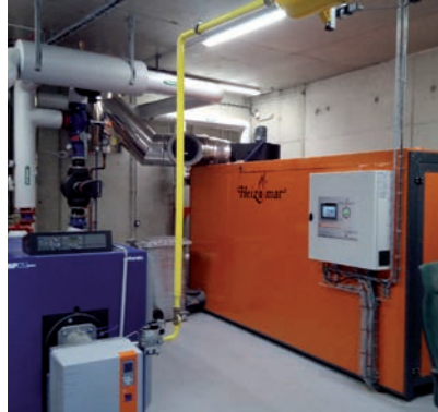
Point sur les travaux