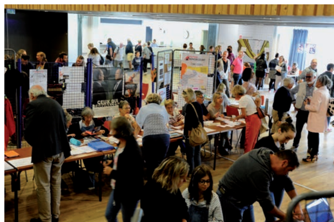
Forum des associations