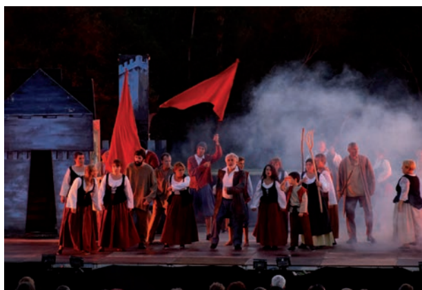
Son & lumières des «Bonnetts rouges»