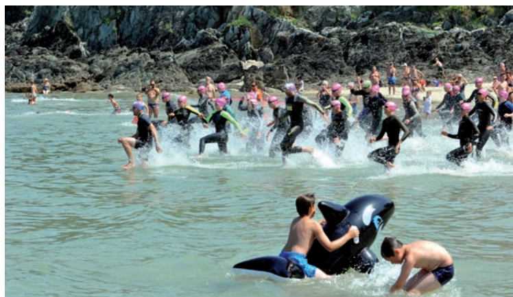
Traversée de la Baie