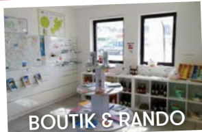
BOUTIK & RANDO