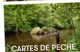
CARTES DE PECHE