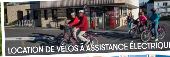
LOCATION DE VÉLOS À ASSISTANCE ÉLECTRIQUE