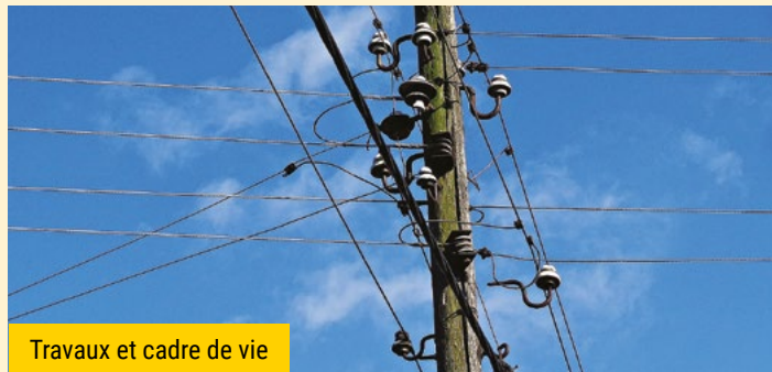
Travaux et cadre de vie

Le service Eau et Assainissement de Lannion Trégor Communauté informe que des travaux de réhabilitation du réseau d'eau potable ont lieu jusqu'au 23 avril dans la rue Claude Coty (des 4 chemins à Toul an Hery).