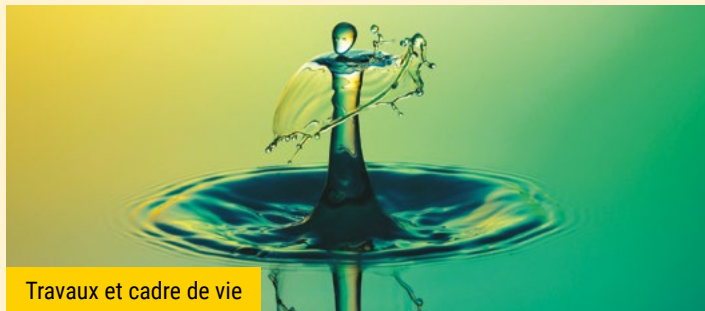
Travaux et cadre de vie