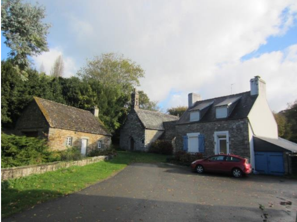
Les abords immédiats du site (photos 1 et 2)

Depuis l'espace maritime, les vues sont plus fréquentes et sont même perceptibles depuis la commune voisine de Locquirec.